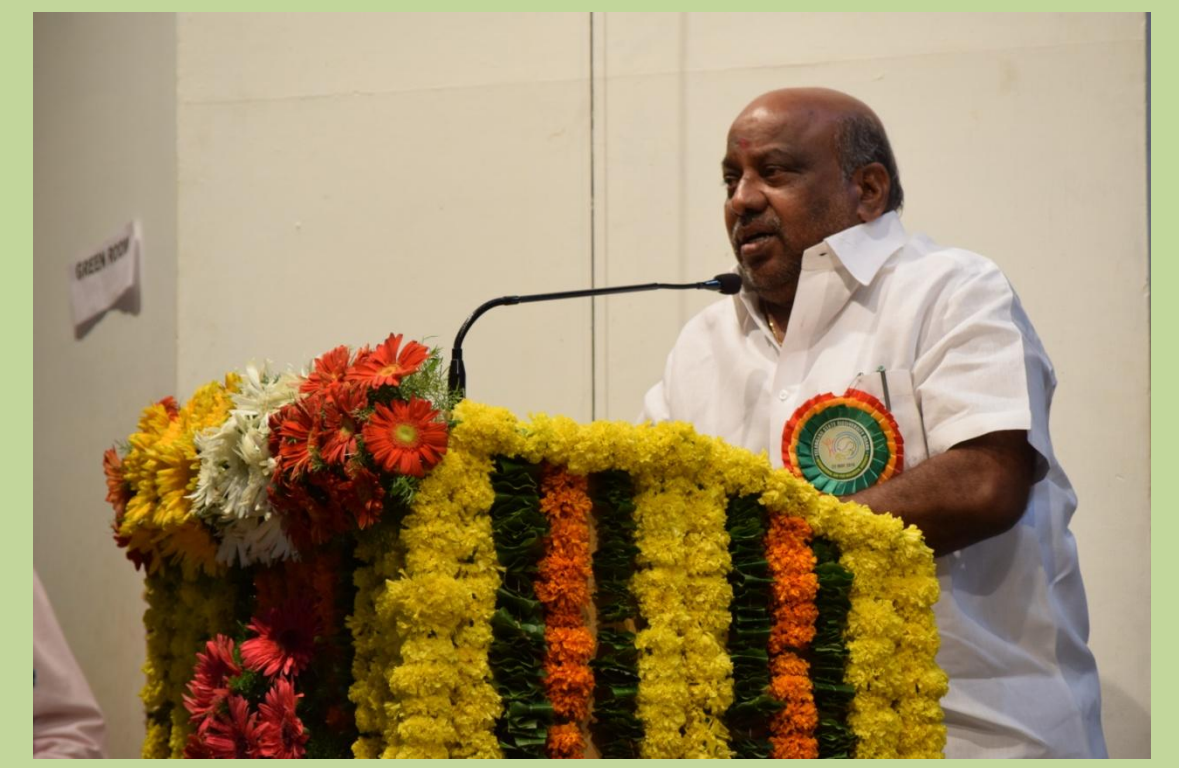
controlling the pollution, Forest cover needs to improved, Biodiversity needs to improved, Microorganism, birds, animals, reptiles needs to be conserved. He

He suggested that each one us to support and conserve the Biodiversity. The local people should be aware of the importance of the Biodiversity and they should be involved to protect the nature and biodiversity. Day by day the natural resources are disappearing due to climate change, Global warming as well. He also suggested and requested the citizens of India and people other countries about the need to take proper measurements towards increasing ground water, and our 5 elements, All the people need to take up the plantation activities in their respective areas, rain water to be harvested, proper measurements for